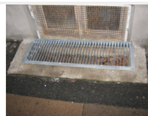
Tremmerist: Ribber i kun EN retning.

( Hvis den gamle rist IKKE kan fjernes, for opmåling af selve hullet, k a n mål taget på selve risten bruges )