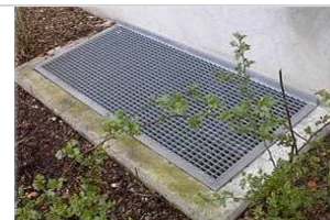
Alm. Standard lyskasserist: Maskestr. 30x30 mm.